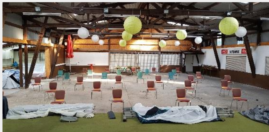
Abb. 2: Bild Darstellung Sitzplan mit Blick von der Bühne

Hierzu wurden Flächen, in der Größe von jeweils 2m x 2,50m eingezeichnet und entsprechend markiert. Dadurch ist sichergestellt, dass jeder/m Sängerin/Sänger die geforderten 3,5qm bis 7qm Fläche zur Verfügung stehen.