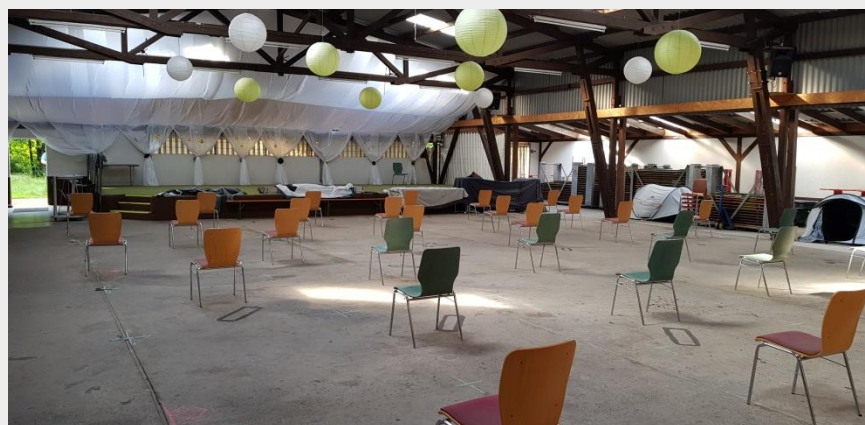
Abb. 3: Bild Darstellung Sitzplan von hinten